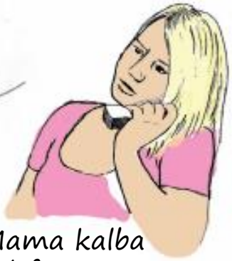
Mama kalba telefonu