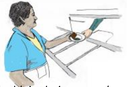
Valgykloje, kai personalas dirba