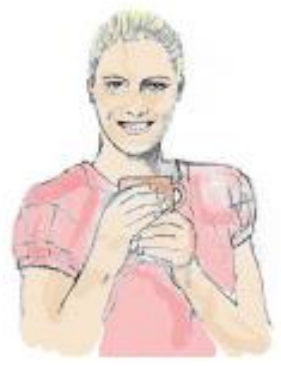
Mokytoja pertraukos metu