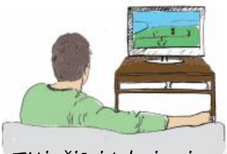
Tėtis žiūri televizorių.

Pažiūrėkite į paveikslėlius ir aptarkite ar tai tinkamas metas pasikalbėti. Galite praplėsti šią veiklą įtraukdami kitų situacijų.